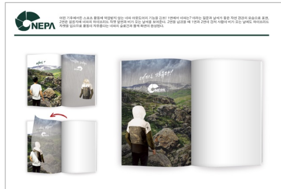
인쇄 광고의 활용 방법이나 재질 등에 대한 설명이 필요한 경우